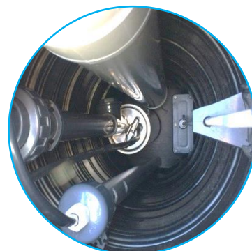
Option Irrigation avec système IRRIGO® - Sortie Haute

INSTALLATION : En complément de la notice de pose fournie avec l'unité d'épuration, l'installateur devra respecter les règles du DTU 64.1. « Mise en œuvre des petites installations d'assainissement autonome ».