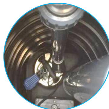
Option Relevage - Sortie Haute